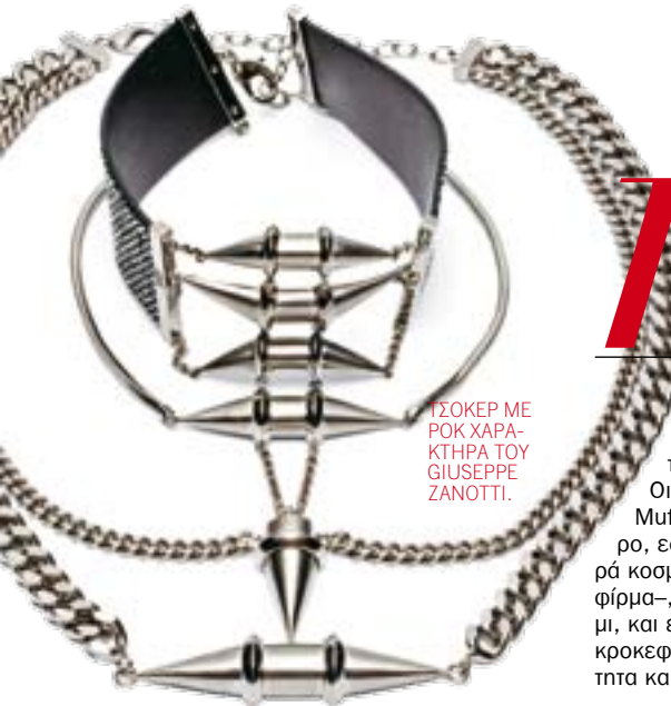
ΤΣΟΚΕΡ ΜΕ ΡΟΚ ΧΑΡΑΚΤΗΡΑ ΤΟΥ GIUSEPPE ZANOTTI.

Παρομοιάζοντάς τα άλλοτε με πολύτιμα objects και άλλοτε με δημιουργίες που προορίζονται για skin decoration, οι κριτικοί μόδας εντοπίζουν το ξεχωριστό ύφος των κοσμημάτων από την παρθενική συλλογή του Giuseppe Zanotti. Χάρη στη μεγάλη του εμπειρία ως σχεδιαστής υποδημάτων και, φυσικά, την εφευρετικότητά του, ο Ιταλός δημιουργός εμπνεύστηκε κοσμήματα ιδιαίτερα και αυτοτελή. Ο ίδιος, αναφερόμενος στα μπρασελέ, κολιέ, τσόκερ, rargure και παβέ δαχτυλίδια με μαύρα και ροζ κρύσταλλα από τη συλλογή του με τίτλο «Pop Decor», τα παρομοιάζει με γλυπτά, τονίζοντας παράλληλα την αρχιτεκτονική τους δομή. Οι δημιουργίες του κορυφαίου Ελβετού σχεδιαστή κοσμημάτων Patrik Muff για τον οίκο πορσελάνης Nymphenburg, πάλι, χρωστάνε τον ιδιαίτερο, εφηρμοσμένο χαρακτήρα στην πρωτότυπη πρώτη ύλη τους. Για τη σειρά κοσμημάτων «Essentials II»—τη δεύτερη που σχεδιάζει για τη γερμανική φίρμα—, ο Muff επέλεξε τον συνδυασμό της πορσελάνης με χρυσό και ασήμι, και εστίαστηκε σε αρχαιολογικά σύμβολα, όπως η καρδιά, ο σταυρός, η νεκροκεφαλή και η άγκυρα, που συμβολίζουν την αγάπη, την πίστη, τη ματαιότητα και την ελπίδα αντίστοιχα. ΗΛΕΚΤΡΑ ΚΑΝΕΣΤΡΙ